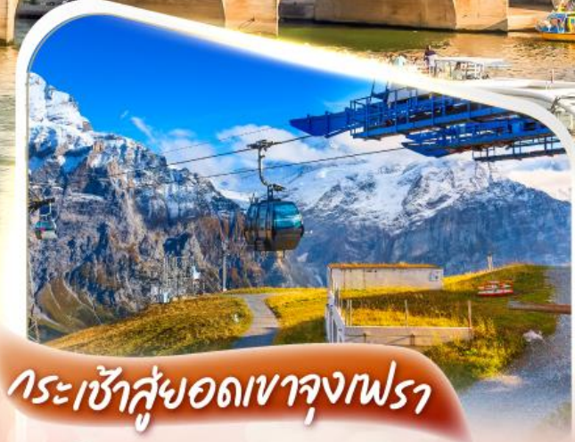
กระเช้าสู่อยอดเขาจุงเฟรา