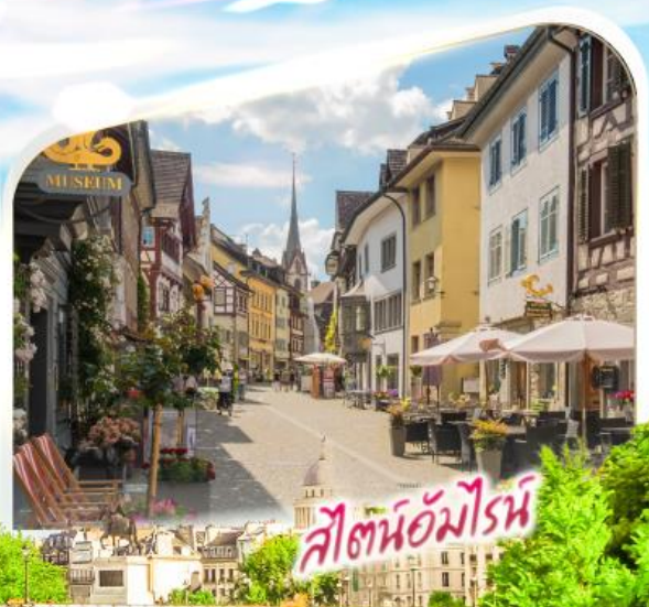
สวิตเซอร์แลนด์