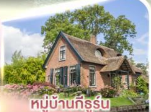
หมู่บ้านกิธูร์น