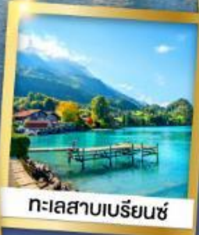
ทะเลสาบเบรีนซ์