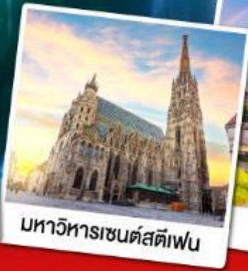
มหาวิหารเซนต์สตีเฟ่น