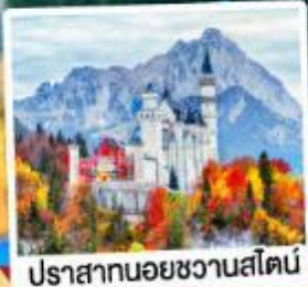
ปราสาทน้อยชวานส์ไตน์

08-14, 16-22, 21-27 ต.ค. 69 04-10 พ.ย. 69 29 พ.ย.-05 ธ.ค. 69 30 ธ.ค. 69-05 ม.ค. 70