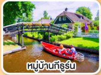
หมู่บ้านทีร์รูม