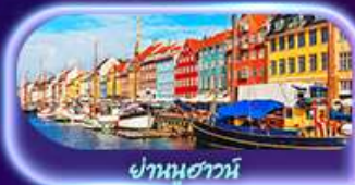
ย่านนูฮาวน์

ชมความงามบอสโตนอร์ดิคสุดมหัศจรรย์ สถาปัตยกรรม โบสถ์กัมเพลยงคีโอ อาสนวิหารออสเพนสกี อนุสาวรีย์ซิมบลูส พิกัดห้ามพลาดจัตุรัสวุฒิสภาเฮลซิงกิ เยี่ยมชมพิพิธภัณฑ์ทว่าซา ศาลาว่าการสตอกโฮล์ม ย่านเมืองเก่า Gamla Stan ถ่ายภาพ Oslo Opera House สวนมนุษย์ชาติ Vigeland ป้อมปราการอาเครสฮูส มหาวิหารออสโล เซ็คอินแลนด์มาร์คน้ำพุเทพีออน รูปปั้นนางเงือก พระราชวังอมาเลียนบอร์ก พระราชวังคริสเตียนบอร์ก ย่านคิงส์ยานูฮาวน์ ซ้อมเบียร์เอสplanชาติ ถนนคนเดิน Strøget