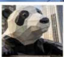
ห้าง IFS หมีแพนด้าเป็นตึก