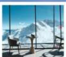
4860 COFFEE SHOP