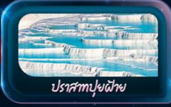
ปราสาทฟูยไฟย