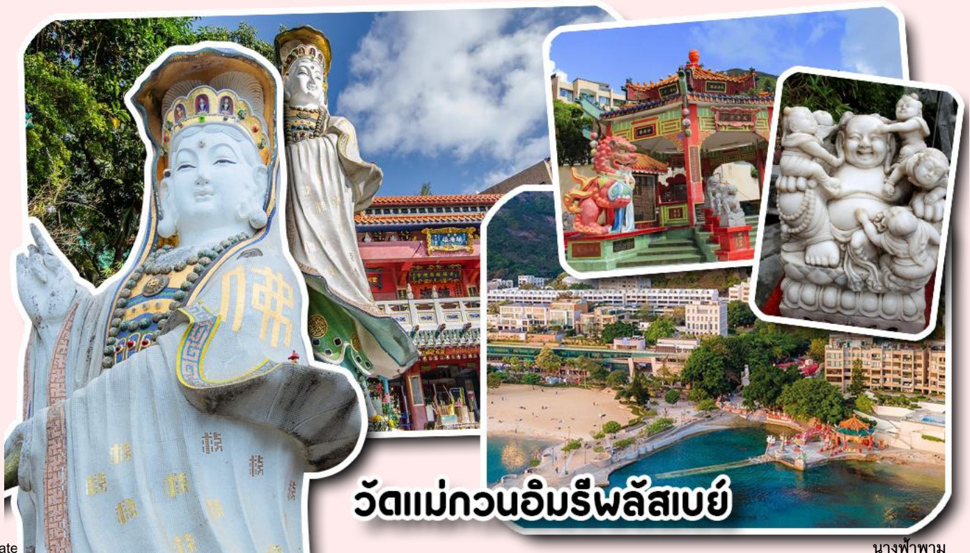
วัดแม่กวนอิมริพลัสเบย์

จากนั้นพาท่านเดินทางไปนมัสการ เจ้าแม่กวนอิมริมหาดริพลัสเบย์ วัดแห่งนี้ถูกสร้างขึ้นเพื่อคุ้มครองชาวประมงเวลาออกเรือไปหาปลาในสมัยก่อน บริเวณวัดมีสิ่งศักดิ์สิทธิ์มากมาย ได้แก่ เจ้าแม่กวนอิม ประดิษฐานอยู่ทางด้านซ้ายของวัด ซึ่งผู้คนนิยมเดินทางไปกราบไหว้ขอพรเรื่องการมีบุตร และยังมีพระสังกัจจายที่เชื่อกันว่าสามารถขอเพศของบุตรที่จะมาเกิดได้ โดยหลังจากกราบไหว้แล้วก็ให้ลูบที่ท้องของพระสังกัจจาย ถ้าอยากได้ลูกชายให้ลูบท้องซ้าย อยากได้ลูกสาวให้ลูบท้องขวา ถัดมาคือ เจ้าแม่ทับทิมเทพีแห่งท้องทะเล ท่านจะคอยคุ้มครองผู้เดินทางทางเรือ หรือผู้ที่เดินทางไปไหนมาไหนท่านจะคอยคุ้มครองให้ปลอดภัย และมีโชคลาก ถัดจากบริเวณที่กราบไหว้ขอพร ก็จะมีศาลาแปดเหลี่ยมริมน้ำ และสะพานเล็กๆ ที่ชื่อว่าสะพานต่ออายุ ซึ่งเชื่อกันว่าหากเดินข้ามสะพานแห่งนี้ 1 ครั้ง ก็จะมีอายุยืนขึ้น 3 ปี