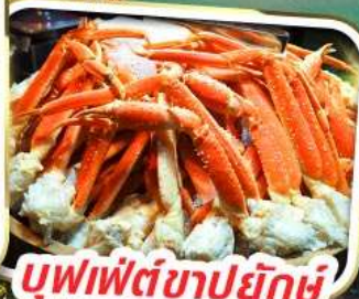
บุฟเฟ่ต์ขาปูยักษ์