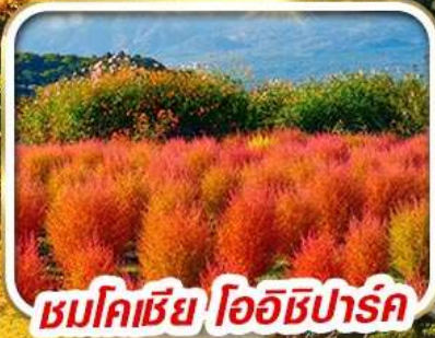
ชมโคเชีย โออิชิปาร์ค