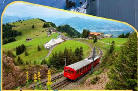
นั่งรถไฟขึ้นสู่ยอดเขาโรทิก