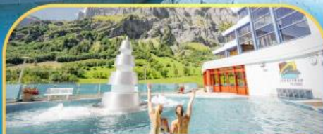
แช่น้ำแร่ร้อนฟ่อนคลายลวยคอร์บิค