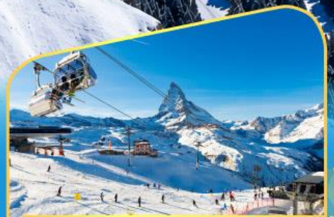
นั่งกระเช้าชมแมทเทอร์ฮอร์น