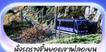
นั่งรถรางขึ้นยอดเขาฟลอยอน

เปิดประสบการณ์สุดว้าว... สักครั้งในชีวิต! ล่องเรือชมฟยอร์ด นั่งรถไฟสายโรแมนติกฟลอยอนข้ามน้ำ เบอร์เกน ชมเมืองท่าบรีคเกน นั่งรถรางขึ้นยอดเขาฟลอยอนชมวิวเมือง ไม่ควรพลาดนั่ง Cable car ขึ้นยอดเขาอูร์ลึเคน ชม Top view ตระการตา ความอลังการระดับมาสเตอร์พีซ จุดชมวิวดัสทาสไนด์ เดินเล่นตลาดปลาเบอร์เกน ขึ้นชมโบสถ์ออสโลเยี่ยมชมโอเปร่าเฮาส์ มหาวิหารออสโล ป้อมปราการอาครส์ฮูส รัฐสภาแห่งนอร์เวย์ สวนอนุสรณ์ Vigeland Sculpture Park ซุปเปอร์มาร์เก็ต Karl Johans gate