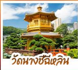
วัดนางชีฉีฉิน