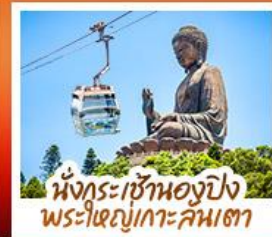
นั้งกระเซ้าแองปิง พระใหญ่เกาะคัมตา