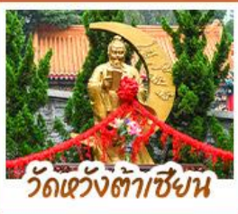
วัดเซ้างต้าเซิน

ขอพรเซangkombing 3 องค์ เรื่องโชคลาภ การเงินและธุรกิจ • มั้งกระเซ้าแองปิง สักการะพระใหญ่เทียนถาน • เจ้าแม่กวนอิมฮ่องฮ่า ขอเรื่องเงิน ทรัพย์สิน ความมั่งคั่งเจ้าแม่กวนอิมทะเล ขอพรเรื่องความสำเร็จ ไขคดีเปิดเป้าสิ่งไม่ดี พิทโงแรม 4 ดาว แหล่งช้อปปิ้ง...ย่านจิมซาจุ่ยหรือย่านมงก๊ก