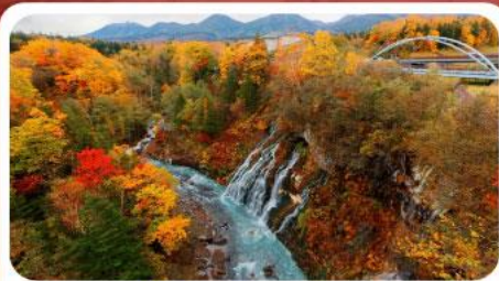
น้ำตกชิราฮิเกะ