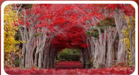
สวนลับชิราโอกะ