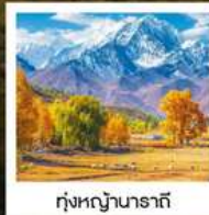
ทุ่งหญ้านาราที

ทัวร์คุณธรรม ไม่ลงร้านช้อปปิ้ง ไม่ขายออฟชั่น