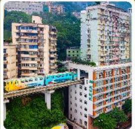
รถไฟกะลุดี้ก