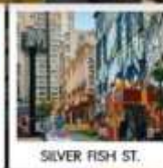
SILVER FISH ST.