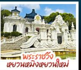
พระราชวัง แชวานเมิงแชวานนิเม