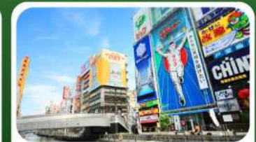
ช้อปปิ้งย่านชินโจบาชิ