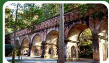
วัดนินเซ็นจิ