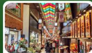
ตลาดปลาชิซึกิ