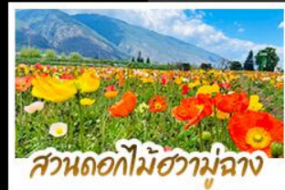
สวนดอกไม้ฮวามู่ฉาง