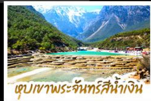
เขุบเขาพระจันทร์สีน้ำเงิน