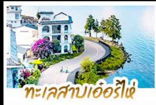
ทะเลสาบเอ๋อร์ไห่