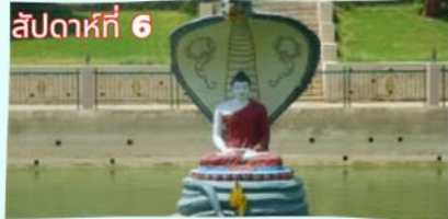
สระมัจฉลินทร์ (จำลอง)