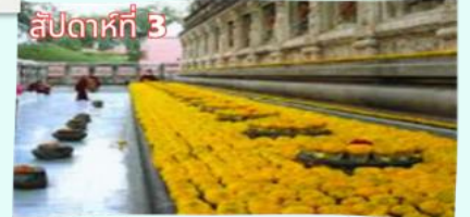
รัตนองกรมเจดีย์