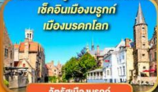
จัตุรัสเมืองบรูคซ์