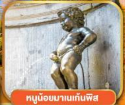
ทูน้อยมาเนกันพิส