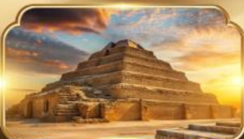
พระมิดขั้นบันได