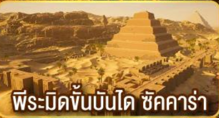
พีระมิดชั้นบันได ชัคคาร์่า