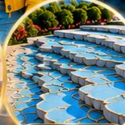
ปานุกคาล์ Pamukkale