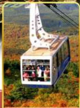
นั่งกระเช้าฮักโกดะ