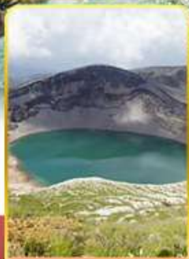
ปากปล่องภูเขาไฟซาโอ