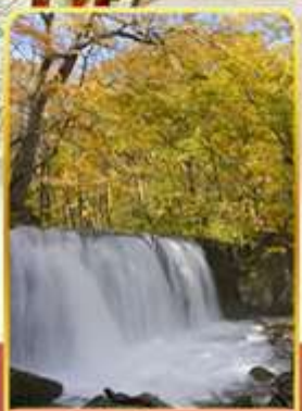
ลำธารโออิราสะ