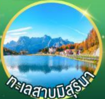
ทะเลสาบมิสุรินา