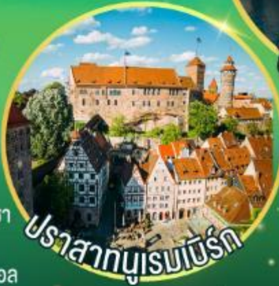
ปราสาทบูเรนเบิร์ก