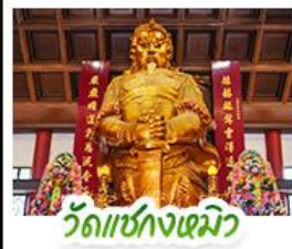
วัดเข่งกงเมียว

พัก 4 ดาว ย่านช้อปปิ้งจิมซาจуйหรือย่านมงก๊ก สนุกสนานไปกับสวนสนุกดิสนีย์แลนด์แบบเต็มวัน (รวมรถรับ-ส่ง) วิวหวัดต้าเซียน หอพระด้านสุขภาพ • วิวแซงหมิว หอพระโชคกลาง การเงินและธุรกิจ • เจ้าแม่กวอนอิมชองฮ่า นมัสการองค์เจ้าแม่กวอนอิม ที่มีอายุกว่า 600 ปี • นั่งกระเช้าเองปีงลิงการ์-พระใหญ่เทียนถาน