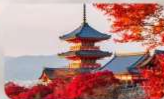
วัดคิโยมิชิ