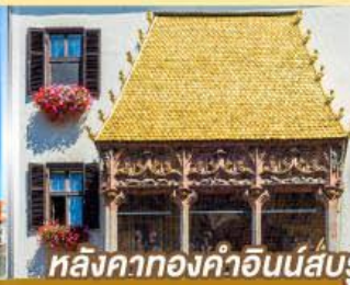
หลังคาทองคำอินน์สบูร์ค