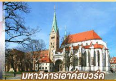
มหาวิหารเอาค์สเวิร์ค