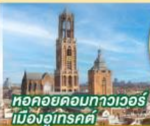
หอคอยคอกทาวเวอร์ เมืองอูเทรคต์