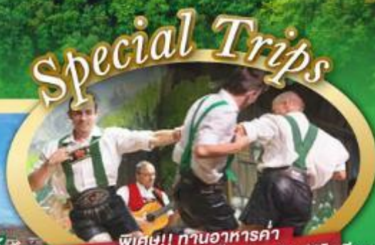
พิเศษ!! ทำอาหารค่ำ พร้อมชมการแสดงดนตรีพื้นเมืองสไตส์โรเซียม และเขื่อนเมืองอูเทรคต์ สีสันใหม่เนเธอร์แลนด์