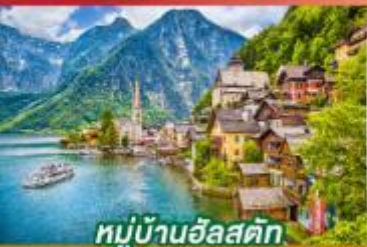
หมู่บ้านอัลสติก