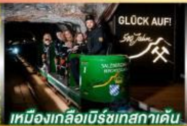
เหมืองเกลือเบียร์ชเทสกาเดิน