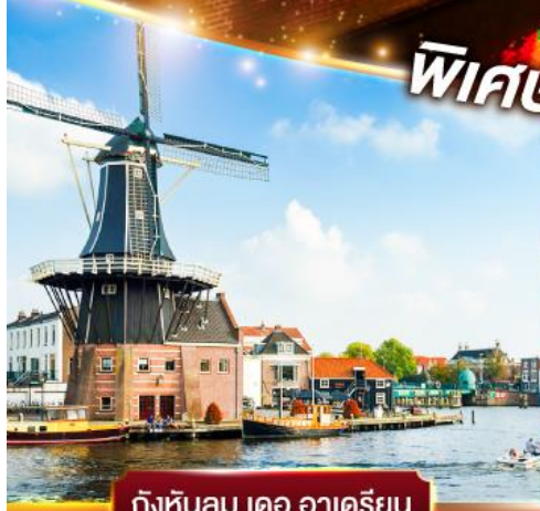
กังหันลม เดอ อาเดรียน