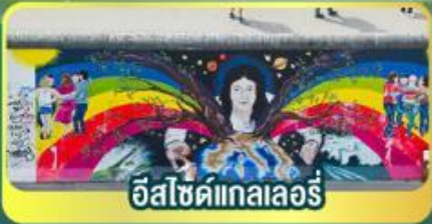
อีสไซด์แกลลอรี่