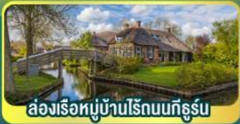
ส่องเรือหมู่บ้านไรทอนนทีธูร์บ