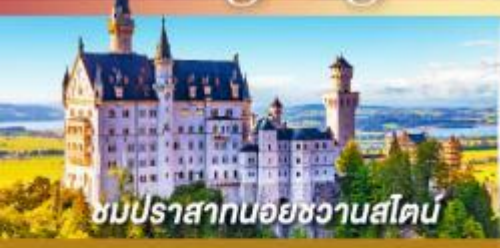
ชมปราสาทน้อยชวานสไตน์