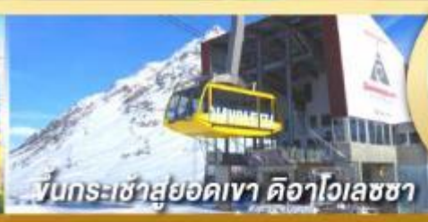
ขึ้นกระเช้าสู่ยอดเขา ดือาไวเลซซา