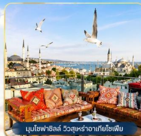
มุบไซฟาซิลส์ วิวสุเหร่าอาเกียโซเฟีย

ห้องแคบบอสฟอรัส • สุหร่าน้ำเงิน • สุเหร่าอาเกียโซเฟีย