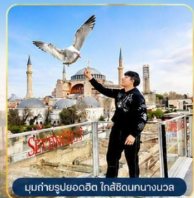
มุบถ่ายรูปรูปยอดฮิต ใกล้ชิดนกนางนวล