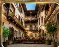
บ้านเรือนสไตล์ออตโตมัน อายุกว่า 200 ปี

เมืองท่องเที่ยวที่มีชื่อเสียงของจังหวัดการาบึก (Karabük) ในปี 1994 เมืองซาฟรานโบลู ได้ถูกองค์การยูเนสโกยกให้เป็นมรดกโลกทางด้านวัฒนธรรม