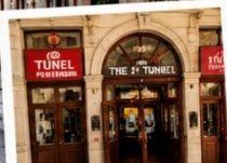
สถานีทูนเนล (TUNEL STATION) สถานีรถไฟใต้ดินสายเก่าแก่ และเป็นหนึ่งในระบบขนส่งที่เก่าแก่ที่สุดในโลก