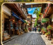
เดินเล่นย่านเมืองเก่า บสยภาคชองยุค