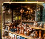
เลือกซื้อของฝาก งานหัตถกรรมพื้นเมือง

สัมผัสเสน่ห์แห่งอดีตในเมืองที่เวลาเดินช้าลง กับสถาปัตยกรรมอันงดงาม วัฒนธรรมที่ยังคงมีชีวิต และความอบอุ่นจากผู้คน