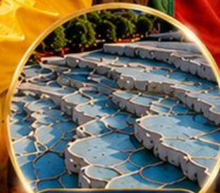
ปามุกคาล่า Pamukkale