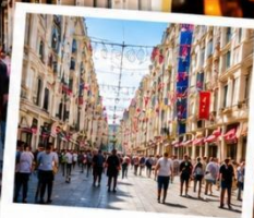
ISTIKLAL STREET (Grand Avenue of Pera) ถนนสายช้อปปิ้ง ยิม ฮิล ครอบคลุมพื้นที่ผิว