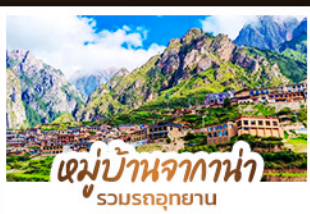
หมู่บ้านจากาน่า รวมรถอุทยาน