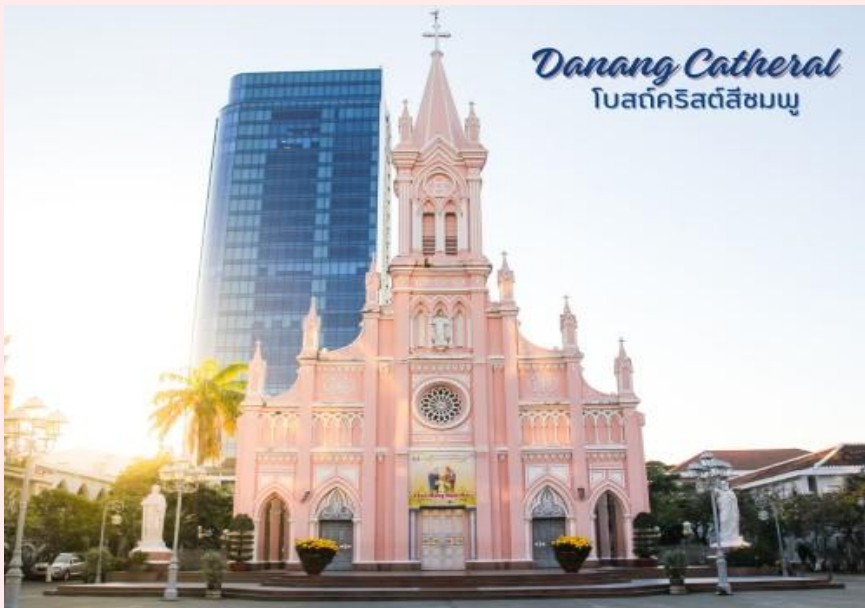
Danang Cathedral โบสถ์คริสต์สีชมพู

นำท่านถ่ายรูป โบสถ์คริสต์ดานัง หรือโบสถ์คริสต์สีชมพู (Danang Cathedral) สร้างขึ้นสมัยเวียดนาม ตกเป็นอาณานิคมของฝรั่งเศส สถาปัตยกรรมสไตล์โกธิก ยตกแต่งด้วยความประณีตสวยงาม ตัวโบสถ์เป็นสีชมพูทั้งหลัง ตัดขอบด้วยสีขาว เป็นอีกหนึ่งสถานที่ที่ไม่ควรต้องพลาดเมื่อมาเยือนเมืองดานัง จากนั้น อีตระช้อปปีง ตลาดฮาน อีตระเลือกซื้อสินค้าหลากหลายชนิด เช่นผ้า เหล้า บุหรี่ และของกินต่างๆ เป็นตลาดสดและขายสินค้าพื้นเมืองของเมืองดานัง