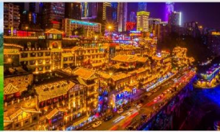
หงหยาดิ่ง