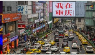
กวนอิมเจียว

*ทางบริษัทฯ ขอสงวนสิทธิ์ในการสลับโปรแกรมทัวร์ตามความเหมาะสมขึ้นอยู่กับสถานการณ์หน้างาน โดยคำนึงถึงผลประโยชน์ของลูกค้าเป็นสำคัญ