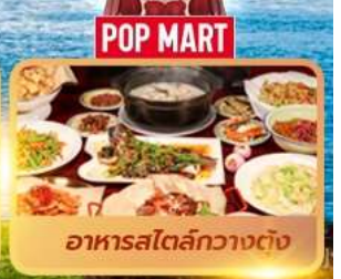
อาหารโตลี้กวางตุ้ง