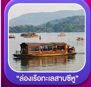
“ล่องเรือทะเลสาบซีหู”