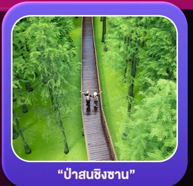
“ป่าสนชิงซาน”

T2G-HGH01GJ Welcome Hangzhou...หังโจว ฉู่โจว ฉู่หยวน ช่างเหรา หุบเขาเทวดา 5D 4N (GJ)