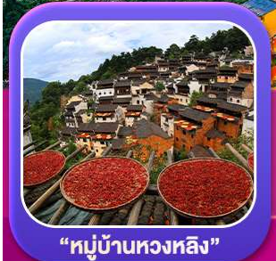
“หมู่บ้านหวงหลิง”

หุบเขาเทวดาวังเซียนกู่ หมู่บ้านที่ตั้งอยู่ริมหน้าผา • หมู่บ้านโบราณหวงหลิง ป่าสนน้ำชิงซาน • ล่องเรือทะเลสาบซีหู • ถนนโบราณตุ๋นโจ้ว • ชมแสงสีที่ ฉู่หนีโจ้ว