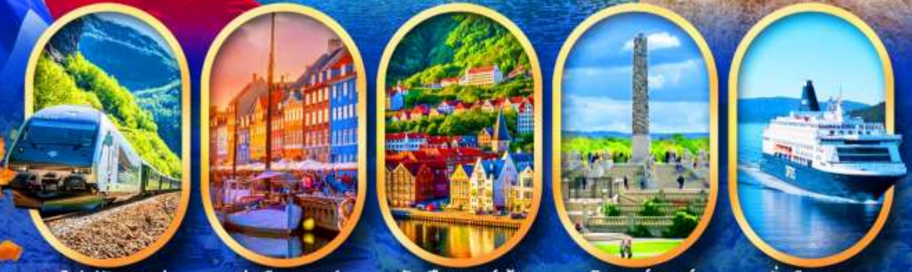
รถไฟฟลิมสขาน่า ท่าเรือฮาวน์ พักเมืองเบอร์เก็น วิกเกอร์แลนด์ นั่งเรือ DFDS