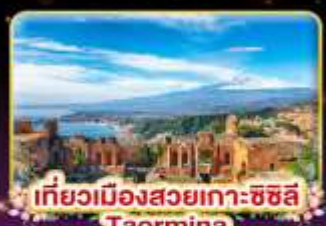
เที่ยวเมืองสวยเกาะซซิลี Taormina