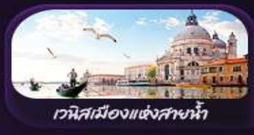
เวนิสเมืองแห่งสายน้ำ