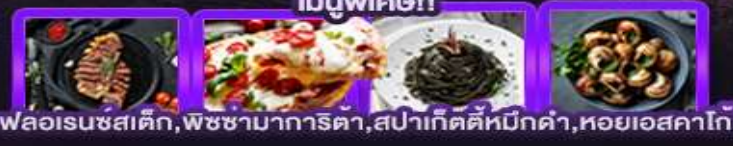
พลอเรนซสติก, พิซซามาการิตา, สปาเก็ตตีหมีกดำ, หอยเอสคาโท