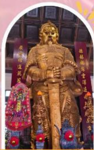
วัดแซกซง ขอพรโชคลาก การเงิน และธุรกิจ