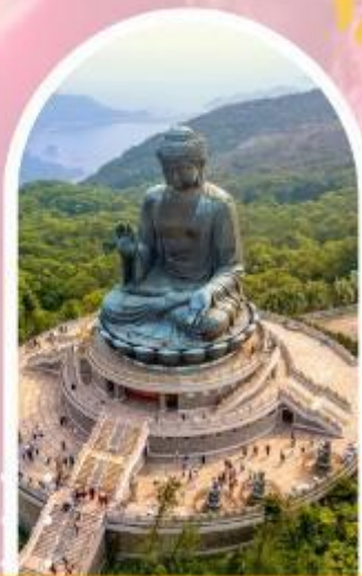
นั่งกระเช้ามองปิง นมัสการพระใหญ่โป่วหลิน