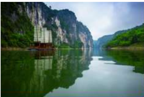
ล่องเรือ เหมาหยินเหอ