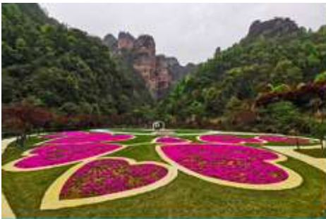
อุทยานฟงเหลียนซี