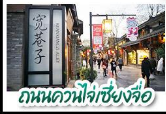
ถนนควานไห่จางเซียงจื่อ