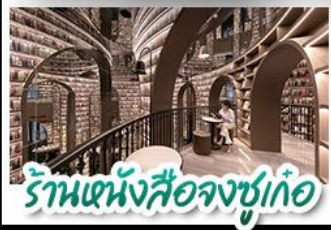
ร้านหนังสือจตุรทิศ

อุทยานสัตว์ดุณี - อุทยานปู้เผิงโกว - วัดต้าจื่อ หมีแพนด้าบนเชลฟี - ร้านหนังสือจตุรทิศ ถนนโบราณชอยกว้างชวยแคบ ช้อปปิ้งถนนไถ่กุ่หลี่ + ถนนชุนชู่ CHENGDU TIMES OUTLETS