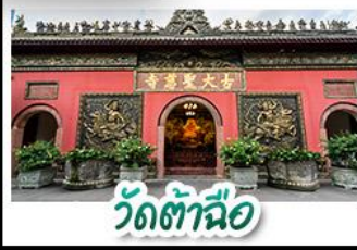
วัดต้าจื่อ