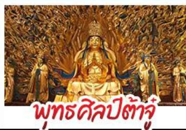
พุทธศิลป์ต้าจู๋