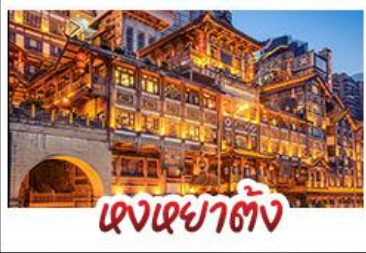
เจียงหยาดัง