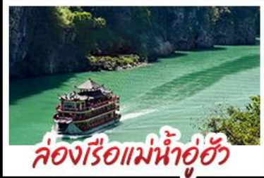
ล่องเรือแม่น้ำอู๋ฮัว

ฉงชิ่ง - อุ๋หลง - เจียนเจียง หลุมฟ้าสามสะพานสวรรค์ - หงหยาดัง พุทธศิลป์ต้าจู๋ - ล่องเรือแม่น้ำอู๋ฮัว