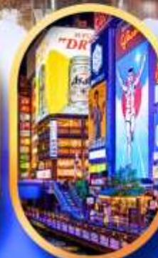
ย่านชิบะฮาชิ