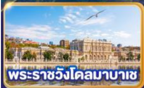
พระราชวังโดลมาบาซ