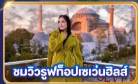
ชมวิวรูปทิวลิปเซเวนฮิลส์

📅 เดินทาง : 03-11, 10-18, 17-25, 22-30 ต.ค. 69 31 ต.ค. - 08 พ.ย. 69 / 07-15, 21-29 พ.ย. 69 03-11, 19-27 ส.ค. 69 26 ส.ค. 69 - 03 ม.ค. 70 30 ส.ค. 69 - 07 ม.ค. 70