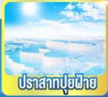
ปราสาทฟูยฟาย